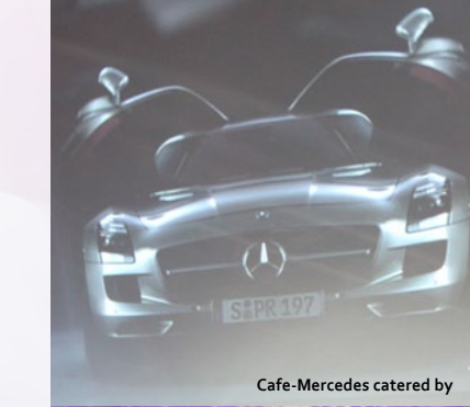
Cafe-Mercedes catered by

Gesamtpreis für Refektorium des Fürstlichen Schlosses Thurn & Taxis inkl. Kreuzgang und Garten Kreuzgang ab 13.500,- €